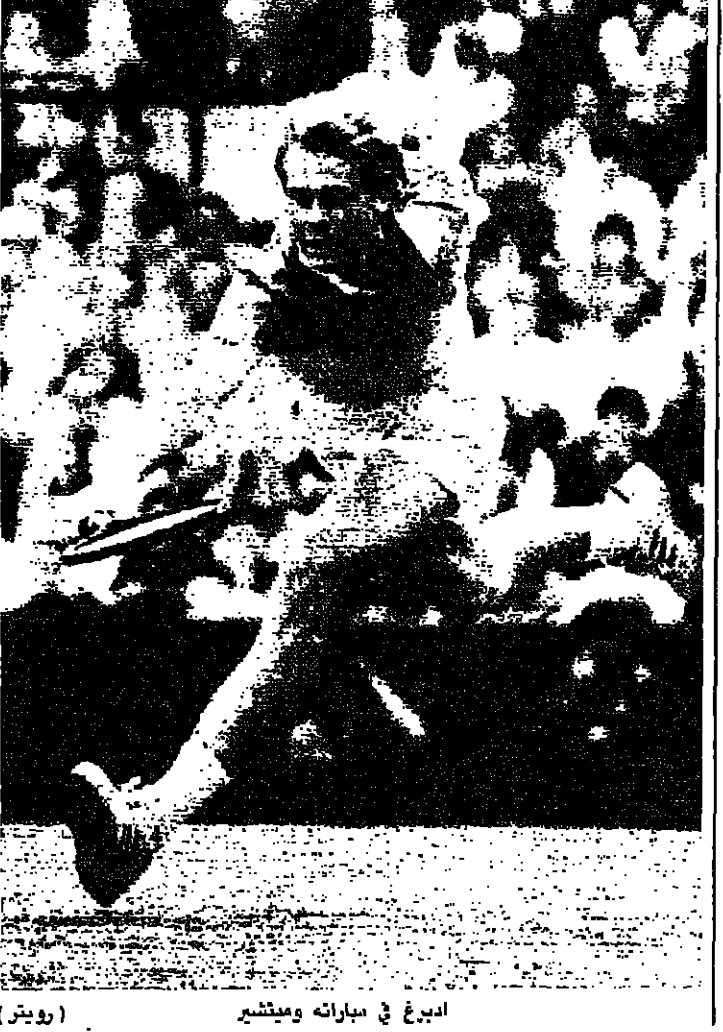
ادبرغ في مباراته ويميتشير